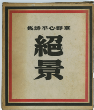
草野心平詩集『絶景』(函) 1940年9月 八雲書林

詩人・草野心平は、「天」「富士山」「蛙」「石」などを主題とした詩を多く書きましたが、1,400余篇の詩の中で、「相当数書い」と自覚している主題の一つに「海」があることは、あまり知られていません。間断ない波の動作を動詞を完結させずに表そうとした「窓」、破調的な重量のあるリズムをつくった「日本海」、幻想的に書いた「Bering-Fantasy」、日本語の文字の形象を意識した「磐城七浜」など、創作の際のエピソードをあかしている「海」を主題とした詩篇の他、故郷・いわきの沿岸部や国内外の海について触れた随筆で、生誕120周年を迎える詩人の創作上の「海」、体験した「海」を紹介します。