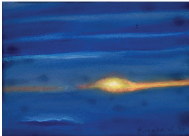
草野心平パステル画「波陽」 1977年

詩人・草野心平は、「天」「富士山」「蛙」「石」などを主題とした詩を多く書きましたが、1,400余篇の詩の中で、「相当数書い」と自覚している主題の一つに「海」があることは、あまり知られていません。間断ない波の動作を動詞を完結させずに表そうとした「窓」、破調的な重量のあるリズムをつくった「日本海」、幻想的に書いた「Bering-Fantasy」、日本語の文字の形象を意識した「磐城七浜」など、創作の際のエピソードをあかしている「海」を主題とした詩篇の他、故郷・いわきの沿岸部や国内外の海について触れた随筆で、生誕120周年を迎える詩人の創作上の「海」、体験した「海」を紹介します。