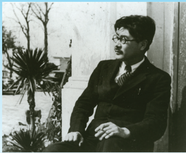
草野心平（くさのしんぺい 1903～1988） 南京中日文化協会にて 1942年