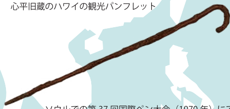
ソウルでの第37回国際ペン大会(1970年)にて 川端康成からもらったステッキ