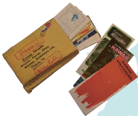
心平旧蔵のハワイの観光パンフレット