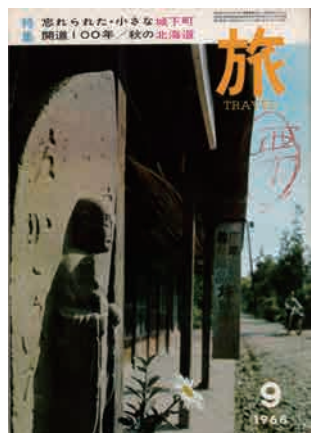
「旅」第42巻第9号 1968年9月 日本交通公社

詩人・草野心平(くさのしんぺい 1903~1988)は、「天」「富士山」「蛙」「石」などを主題に、生涯で1,400余篇の詩を残しました。心平は、詩だけでなく、多様な分野で精力的に活動しましたが、その一つが国内外への様々な理由での移動、つまり「旅」です。心平は若干18歳で中国広州に渡り、嶺南大学に入学しましたが、在学中も香港や韶関に著名人を訪ねたり、帰省中に京都や水戸に足をのぼしたりと、ごく若い頃から移動をいといませんでした。国内はもちろん、中国以外ではウズベキスタンやインド、ヨーロッパ諸国、アメリカなど、機会があれば旅しました。